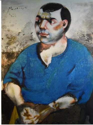
02 | Michael Mathias Prectl, Selbstbildnis im blauen Hemd, 1961, Tempera, Tusche, Farbstift auf Papier, 88,0 x 70,0 cm, Stadtmuseum Amberg.