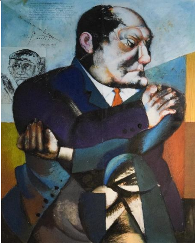
01 | Michael Mathias Prectl, In memoriam Max Beckmann, 1960, Tempera, Tusche, Farbstift, Lithodruck auf Papier, 91,0 x 76,0 cm, Stadtmuseum Amberg.